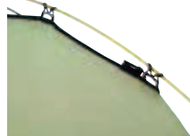
Clip-On-System für schnellen Auf- und Abbau