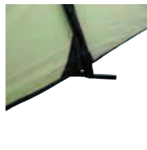
Gestängetasche am Kanalende für schnellen Aufbau