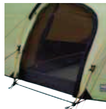
Moskitonetz in seitlichem Eingang