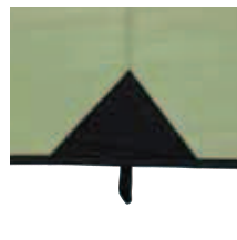
Verstärkungen an allen Stresspunkten