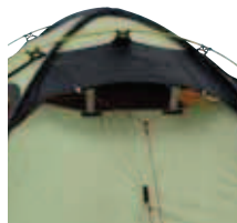
Regensichere Lüftungshauben von innen verschiebbar